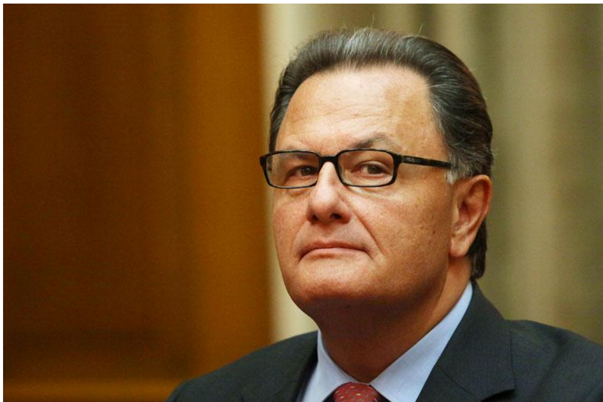
ΜΗΝΥΜΑ ΥΠΟΥΡΓΟΥ ΠΟΛΙΤΙΣΜΟΥ ΚΑΙ ΑΘΛΗΤΙΣΜΟΥ κ. ΠΑΝΟΥ ΠΑΝΑΓΙΩΤΟΠΟΥΛΟΥ