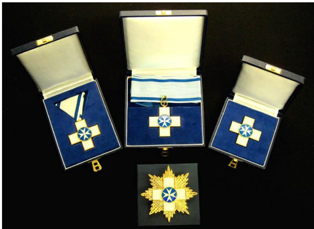
Χρυσό Μετάλλιο Τιμής ΙΩΑΝΝΗΣ ΣΜΥΡΝΙΩΤΗΣ Για το έργο και την προσφορά του στον Πολιτισμό, την Κοινωνική Μέριμνα και τον Αθλητισμό.