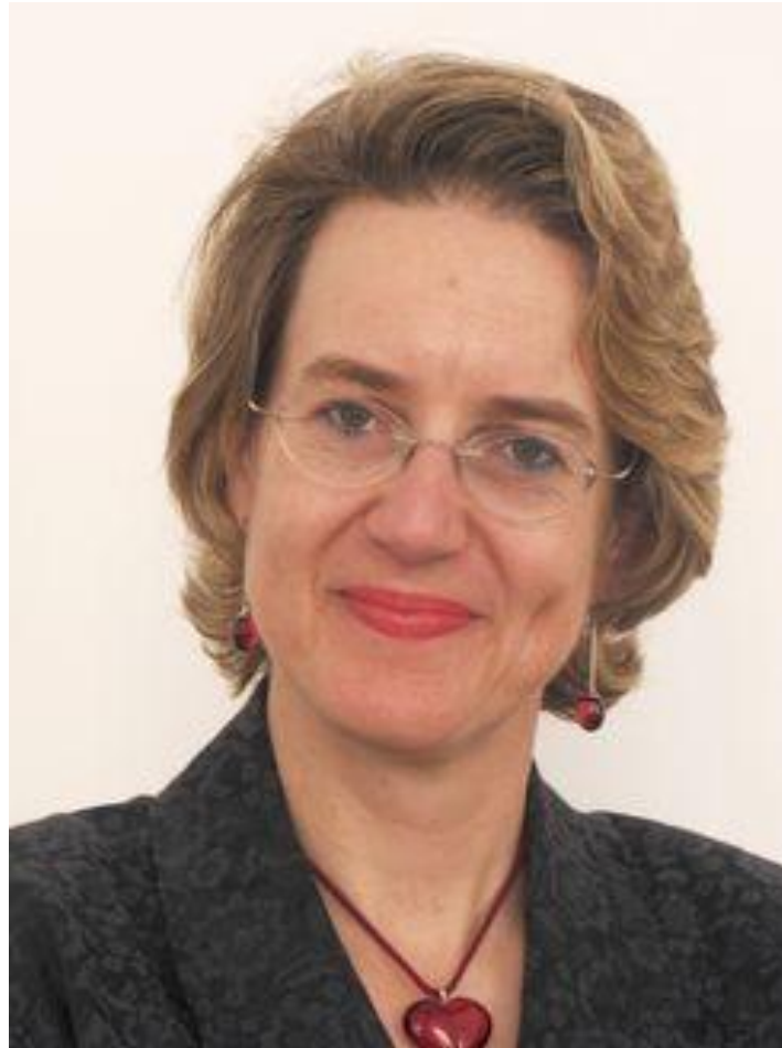
ΜΗΝΥΜΑ ΠΡΕΣΒΗ ΤΗΣ ΑΥΣΤΡΙΑΣ κας MELITTA SCUBERT